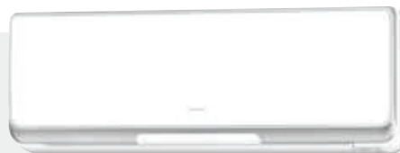
RAK 18-25-35 PSB