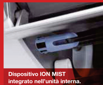
Dispositivo ION MIST integrato nell'unità interna.

Attraverso un dispositivo di nebulizzazione e ionizzazione, vengono immesse in ambiente particelle d'acqua ionizzate invisibili all'occhio umano capaci di ridurre in maniera significativa la concentrazione di batteri, funghi e pollini nell'aria.